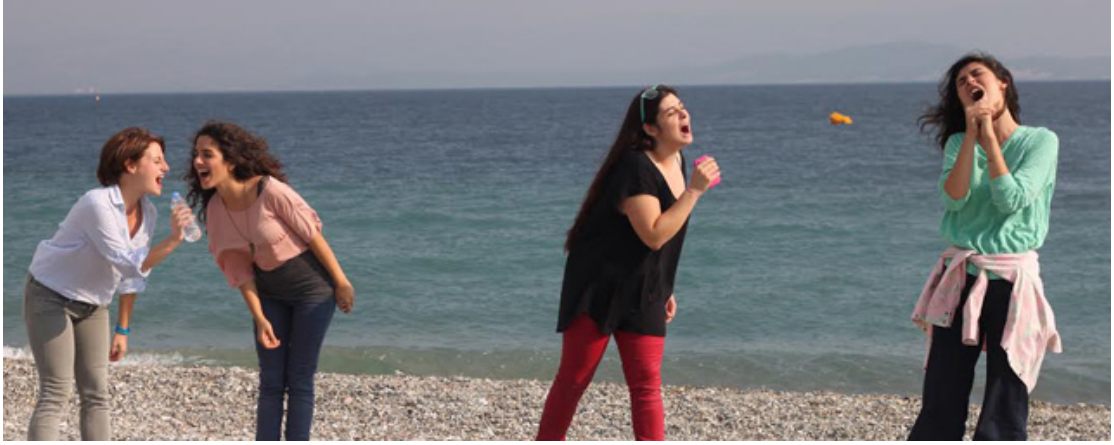
Deniz ve arkadaşları , Mavi Dalga

Benzer şekilde film boyunca genç kadınların eğlenmesi, giyinip kuşanması, süslenmesi de erkek bakışına yönelik unsurlar olarak çıkmaz karşımıza. Tam tersi, bu sahneler kadın bakışıyla sıradan ve gündelik hayat görüntüleri olarak sunulur ki bu da röntgenci erkek bakışına sunulan destansı anlar olmaktan uzaklaşmaları anlamına gelir. Genç kadınların katılacakları ev partisi öncesi birlikte makyaj yaptıkları sahne süslenmenin erkek beğenisinden ziyade kadınların birlikte keyfini çıkardıkları ve paylaştıkları bir durumun anlatısına dönüşür. Laura Mulvey'e (1990) göre geleneksel sinema yapısı içinde erkek karakter aktif ve erk sahibi fail olarak kurgulanır ve dramatik yapı bu kahraman etrafında açılır. İzleyicinin kendisini özdeşleştirdiği de iste bu erkek karakterdir. Bununla birlikte dişi karakter bakılacak bir nesneye dönüştürülmektedir. Mulvey (1989) sinemasal kodların bir bakış yarattığını görsel kültür endüstrisinin seyirciyi ideolojik anlamda şekillendirebilecek gücü olduğunu söyler.