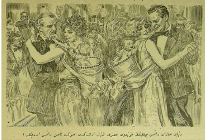
Resimli Ay, Ağustos 1341/Ağustos 1925, Sayı.19, s. 10, (Dünyayı saran dans çılgınlığına tutulan asri kızlar evlendikten sonra nasıl dans edecekler?).

“Hayatın bütün yükü bu zavallı kadının sırtına yüklenmiştir. O hem zevcedir hem annedir hem hayat kadınıdır. Bu üç büyük yükün altında omuzları çökmüş kemikleri kırılmış kadın hayatını kazanmak için tütün fabrikasında çalışır evlerde çamaşırlar yıkar. Pazar yerinde ekmek satar, sebze satar kocasının doyuramadığı sefaya bir dilim ekmek katabilmek için günde on dört saat çalışır. Kocasını adi bir ameledir. Ticari ve sınai bir buhran onun işten kovulmasıyla sonuçlanmıştır. Hastalık ve ölüm bu ailenin her günlük misafiridir. Say ne kadar çok olsa sefalette o kadar çoktur. Fazla say vücuduyla ödenir” (Melahat 1340a, 30).