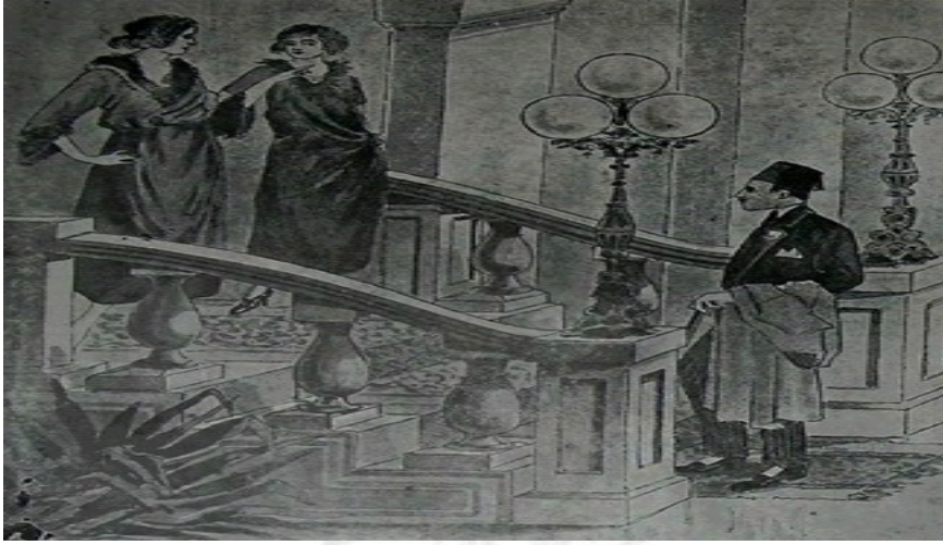
Resimli Ay, Haziran 1341/Haziran 1925, Sayı.17, s. 35.